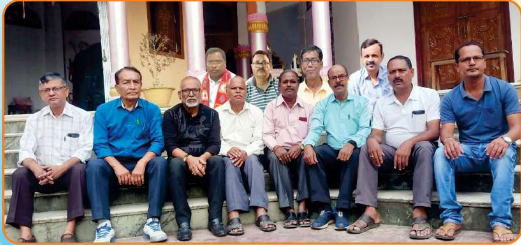
স্মৃতিগ্ৰন্থ সম্পাদনা সমিতিৰ একাংশ