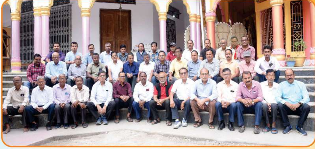
বাবোৰাৰী পূজা কমিটিৰ ২০২৩-২৪ চনৰ বিষয়ববীয়া আৰু সদস্য সকলৰ একাংশ